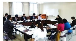
委員の先生方からもたくさんのご意見をいただき、完成しました！