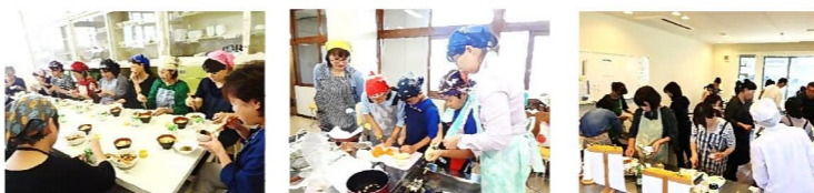
大分県立大分支援学校 佐伯市立渡町台小学校 中津市教育委員会