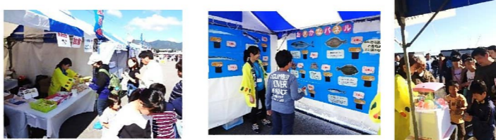
「県産たこめしの素」を使用した「たこめし」です！とても好評でした★

平成30年10月20・21日、別府市亀川漁港で開催された「第37回大分県水産振興祭」に出展いたしました。両日ともお天気に恵まれ、たくさんの来場者に当会のブースにも来ていただきました。たこめしの試食や「豊の魚クイズ」を実施し、学校給食について知っていただく機会になりました。