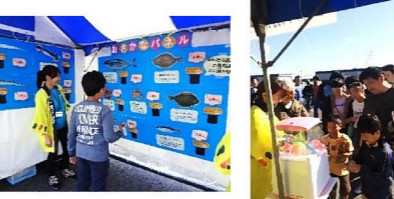
「豊の魚クイズ」も子どもたちに大人気でした！景品のお寿司消しゴムも好評でした