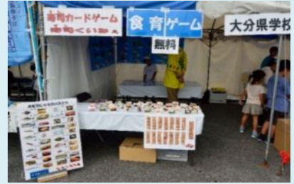
給食会ブースの外観です！

当日は天気にも恵まれ、多くの方に給食会ブースに立ち寄っていただき、学校給食をPRすることができました。