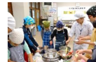
佐伯市立渡町台小学校