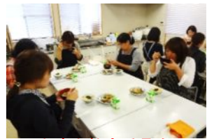
中津市教育委員会