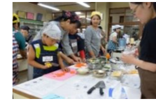
佐伯市立佐伯小学校