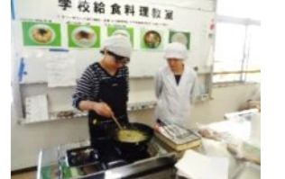
大分県立新生支援学校