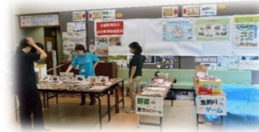
※「野菜計量ゲーム」「魚釣りゲーム」は貸出教材にしていますので、学校での食育授業やイベント等でもご利用ください!

学校給食会では食育イベントにも参加させていただいております。ご用意の際は総務課 企画普及係までご相談ください。