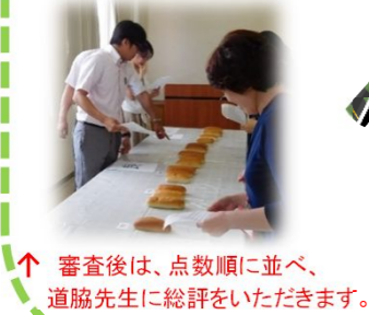
↑ 審査後は、点数順に並べ、道脇先生に総評をいただきます。