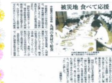
← 平成28年6月8日(水)「北陸中日新聞」でも紹介されたようです!

これにより、大分県の郷土料理(とりめし、とり天等)を取り入れた『大分県応援メニュー』等も提案され、石川県内において「食べることで被災地を応援する支援の輪」が広がっています。