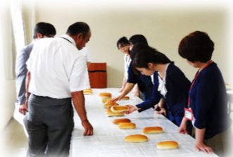
↑ 外観の審査をしています。皮質などをチェックします。

審査は外観4項目(焼色、形の均整、皮質、体積)と、内相5項目(すだち、色相、触感、香り、味)を点数化し、評価していきます。今回の抜取調査における『全体的な評価』及び『「優」評価の工場』を下記に記載しました。