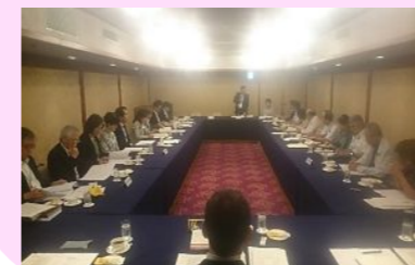
← 学校給食会部会の様子

分科会では、県教育委員会部会と学校給食会部会に分かれ、学校給食会部会では、公益法人としての運営方法などの協議を行いました。