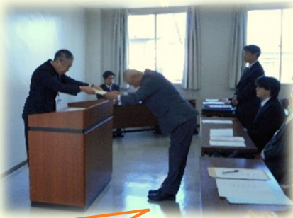
23工場で大分県下の主食を支えています！ よろしくお願いいたします！

平成28年3月に開催した「学校給食用パン加工及び炊飯委託工場選定委員会」において選定された23工場(パン加工:18工場、炊飯:14工場)を平成28年度パン加工及び炊飯委託工場として指定しました。