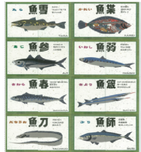
お魚釣り用の魚 表 裏