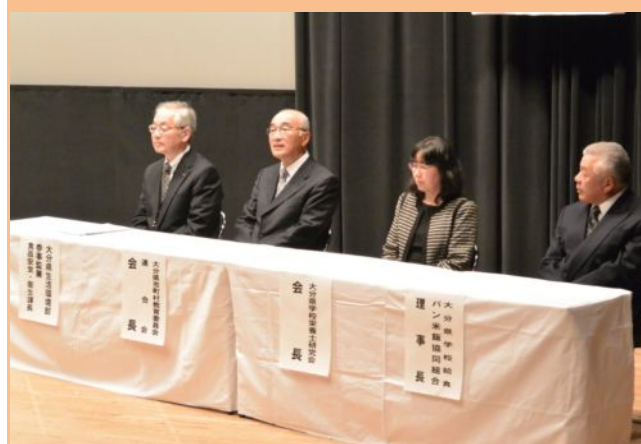
開会行事（来賓紹介）