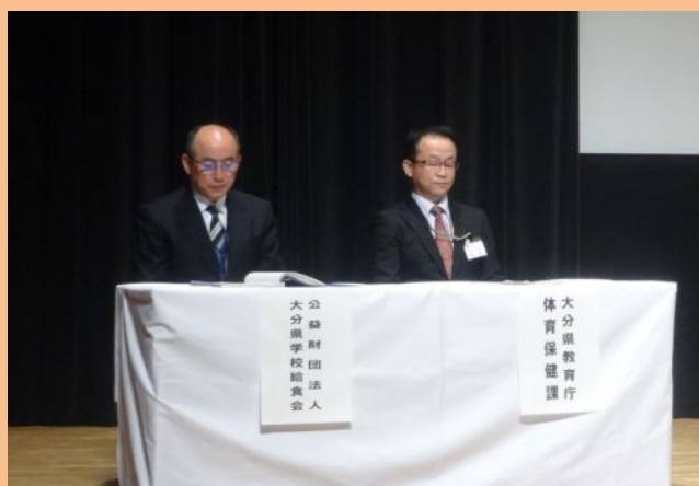
開会行事（主催者紹介）