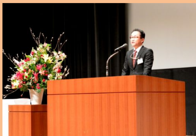
開会行事（主催者あいさつ）